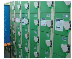
<ロッカー> 住吉図書館は、かばんを持って入ることができません。必ず入り口のロッカーの中にかばんを預けましょう。鍵をかけるのに100円がかかりますが最後にちゃんと戻ってきます。