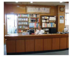
<カウンター> わからないことがあったら、ここでききましょう