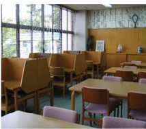
<机> 住吉図書館には、ノートパソコンのための電源やLANがないので、注意しましょう。