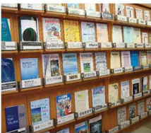
<雑誌> 特に雑誌は充実していて、幼児教育系だけでなく、心理系や福祉系など、静岡県西部の大学でも有数のタイトル数を誇ります。